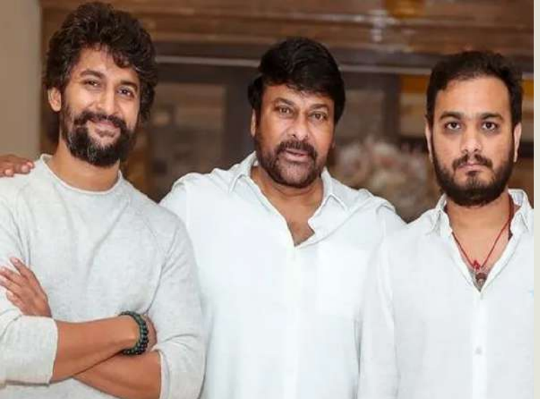
రాసుకున్నాడని అంటున్నారు. మరి ఇదే నిజమే అలానే టాలీవుడ్లో మరో సినిమాటిక్ యూనివర్స్ 'ప్యారడైజ్' విషయంలో హైప్ పెరగడం గ్యారంటీ. మొదలవుతుంది.

ఇప్పుడు హీరోలు కూడా ట్రెండ్ కి తగ్గట్టే సినిమాలు చేస్తున్నారు. ప్రస్తుతం పయలెస్, బీభత్సమైన యాక్షన్ లాంటి అంశాలతో సినిమాలు వస్తున్నాయి. నాని 'ద ప్యారడైజ్' ఈ తరహాలో ఉండబోతున్నట్లు తెలుస్తోంది. శ్రీకాంత్ ఓదెల తీసుకున్న ఈ మూవీలో ఇప్పుడు చిరంజీవి కూడా నటించబోతున్నారనే టాక్ సోషల్ మీడియాలో వైరల్ అవుతోంది. ఇంకా ఏంటి విషయం? 'దసరా'తో తనకు హిట్ ఇచ్చిన డైరెక్టర్ శ్రీకాంత్ ఓదెలకు నాని మరో ఛాన్స్ ఇచ్చాడు. అదే 'ప్యారడైజ్' లెక్క ప్రకారం ఈ పాటికే అంటే మార్కెట్లోనే రిలీజ్ అవుతుంది. కానీ మాటింగ్ అలస్సం కావడంతో ఆగస్టుకి వాయిదా వేశారు. ఇప్పటివరకే ఆగస్టు 21న అని ఫిక్స్ అయ్యారు. ఈ చిత్రం 'ప్యారడైజ్' లోనే చిరంజీవి కనిపించారనేది లేట్ నెస్ రూమర్. 'ప్యారడైజ్' మొదలైన కొన్నాళ్లకే చిరంజీవి కాంట్రాక్ట్ కంట్రాక్ట్ ప్రకటన వచ్చింది. నాని ఈ చిత్రాన్ని నిర్వహిస్తున్నట్లు క్లారిటీ ఇచ్చాడు. అయితే ఈ మూవీకి 'ప్యారడైజ్' తో లింక్ చేస్తున్నారు. అంటే రెండు చిత్రాల్లో హీరోల పాత్రలకు ఒకదానికొకటి సంబంధం ఉంటుంది. అందుకు తగ్గట్టే శ్రీకాంత్ ఓదెల స్క్రిప్ట్