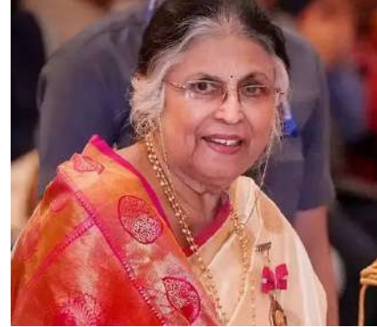
లతా మంగేష్కర్ ను పోలి ఉండటంతో అభిమానులు ఆమెను మరో లతా పిలుచుకునేవారు. ఆరు దశాబ్దాలుగా సంగీత ప్రపంచానికి సేవలందించిన సుమన్ భారత ప్రభుత్వం పద్మభూషణ్ పురస్కారంతో సత్కరించింది.

ప్రముఖ గాయని సుమన్ కల్యాణ్ పూర్ (89) ఇక లేరు. వృద్ధాప్య సమస్యలతో బాధపడుతున్న ఆమె ఆదివారం (మే 31న) సాయంత్రం ముంబైలోని తన నివాసంలో కన్నుమూశారు. చివరి రోజుల్లో ఆమె తన పాటలను వింటూ కాలం గడిపారు. గాయని మృతి పట్ల పలువురు రాజకీయ ప్రముఖులు, సినితారలు సంతాపం ప్రకటిస్తున్నారు.