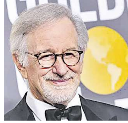
కూడదని హాలీవుడ్ ని కోరుతున్నారు. భవిష్యత్తులో నేను చేసే సినిమాలకు ఏవ అనేది విరుద్ధం. నటి నటుల ఎంపిక, కెమెరాను ఏ కోణంలో పెట్టాలి? డైరెగలు ఎలా రాయాలి? వంటి సృజనాత్మక విషయాలను ఏవ టూల్ నాకు సూచించడానికి నేను పూర్తి వ్యతిరేకం” అని స్టీల్ బర్గ్ పేర్కొన్నారు. - స్టీవన్ స్పెల్ బర్గ్

“సినిమా మేకింగ్ లో సాంకేతికత పెరిగినప్పటికీ మనుషుల భావోద్వేగాలకు ఆర్టిఫిషియల్ ఇంటెలిజెన్స్ (ఏఐ) ప్రత్యామ్నాయం కాదు... కాలేదు” అని హాలీవుడ్ ప్రముఖ దర్శకుడు స్టీవెన్ సోల్ బర్గ్ పేర్కొన్నారు. ఇటీవల స్టీల్ బర్గ్ సినిమా మేకింగ్ లో కృత్రిమ మేధ వినియోగంపై చేసిన వ్యాఖ్యలు సంచలనంగా మారాయి. ఆయన ఏం ఎంతా దాదాంట్... “కళలో మానవీయ కోణం అన్నది ఎంతో ముఖ్యం. రచయితల బేబుల్ వద్దే వద్ద కుర్చీలుగా ఉండి ఆ స్థానాన్ని ఏవ భర్తీ చేయడాన్ని నేను ఇష్టపడను. సాంకేతికత అంతే చింతే లేదా అనుభవించే స్పృహ కంటే అంతర్గత సృజనాత్మకతకు ఏవ ఎప్పటికీ ప్రత్యామ్నాయం కాదు. సినిమా అనేది కొన్ని కమ్యూన్స్ ను మాత్రం కాదు. అది మానవ మేధస్సు, హృదయం నుండి వచ్చే అద్భుత సృష్టి. ఏవని ఒక టూల్ గా ఉపయోగించుకోవడానికి అభ్యంతరం లేదు. సినిమా ఘాటింగ్ కోసం అనుభవన లోకేషన్లు వెతకడంలో ఏవ సహాయం తీసుకుంటే ఓకే. అయితే సినిమా రంగంలో సృజనాత్మక ప్రక్రియకు సంబంధించిన ఏ ఏవ సహాయం ఏవని తుది నిర్ణయంగా తీసుకో