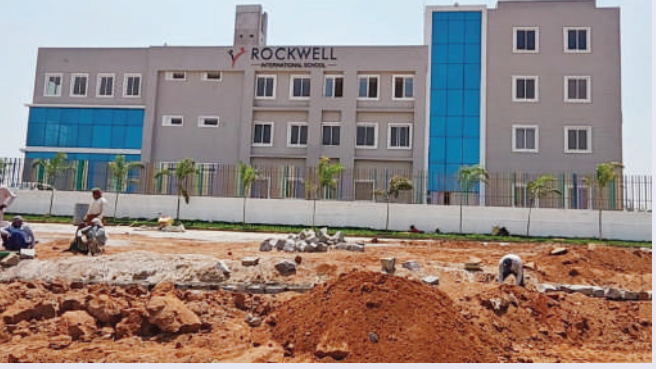
పెద్ద ఎత్తున 10 అడుగుల ఎత్తున నిర్మించి అక్రమ నిర్మాణం చేపట్టారు. వాస్తవంగా జీవో 111 నియమ నిబంధనల ప్రకారం నీటి ప్రవాహానికి అడ్డుగా చెక్ డామ్ లు,

రంగాచెట్టి జిల్లా గ్రేటర్ హైదరాబాద్ మునిసిపల్ కార్పొరేషన్ శంషాబాద్ సర్కిల్ పరిధిలోని శాతరామ గ్రామంలో రాక్ వెల్ ఇంటర్నేషనల్ స్కూల్ యాజమాన్యం జీవో 111కు తూట్ల పొడుపు ఆరాపకానికి తెగపడింది. ప్రభుత్వం నుండి ఎలాంటి అనుమతులు తీసుకోకుండానే 8.5ఎకరాలలో భారీ ఎత్తున అక్రమ నిర్మాణాలు సాగిస్తోంది. జీవో 111లో 100గజాల జాగాలో జీ+1అంతస్తు నిర్మించాలంటే నేషనల్ గ్రీన్ ట్రిబ్యూనల్ (ఎన్టీ) నిబంధనల ప్రకారం భవనం నిర్మించాల్సి ఉంటుంది. కానీ 8.5ఎకరాల చుట్టూ ప్రవారీగడ నిబంధనలకు విరుద్ధంగా