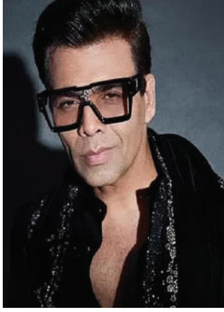
కేవలం మానసిక ప్రశాంతత కోసం తీసుకున్న నిర్ణయమేనని కరణ్ క్షారిటీ ఇచ్చారు.

బాలీవుడ్ దర్శక నిర్మాత కరణ్ జోహార్ ఇన్సాగ్రామ్లో షారుఖ్ ఖాన్, అలియా భట్, రణవీర్ సింగ్ వంటి పలువురు టాప్ సెలబ్రిటీలను అన్ఫాలో చేయడంతో సోషల్ మీడియాలో పెద్ద చర్చ మొదలైంది. దీంతో ఇండస్ట్రీలో విభేదాలు వచ్చాయా? అనే ఊహగానాలు కూడా వినిపించాయి. ఈ నేపథ్యంలో కరణ్ స్వయంగా స్పందిస్తూ.. ఇది కేవలం 'డిజిటల్ డిటాక్' మాత్రమేనని స్పష్టం చేశారు. సోషల్ మీడియాలో అసవసరంగా గడిపే సమయాన్ని తగ్గించుకోవడానికే ఇలా చేశానని చెప్పారు. దీనిని పెద్ద వార్తగా మార్చాడని, క్లిక్ బైట్ కథనాలు ఆపాలని కూడా కోరారు. ప్రస్తుతం కరణ్ ఇన్సాగ్రామ్ ఫాలోయింగ్ సంఖ్య 74కు పడిపోయింది. అయితే ఇది ఎలాంటి వ్యక్తిగత విభేదాలు లేదా ఇందస్త్రీ ద్రావాలకు సంబంధించినది కాదని..