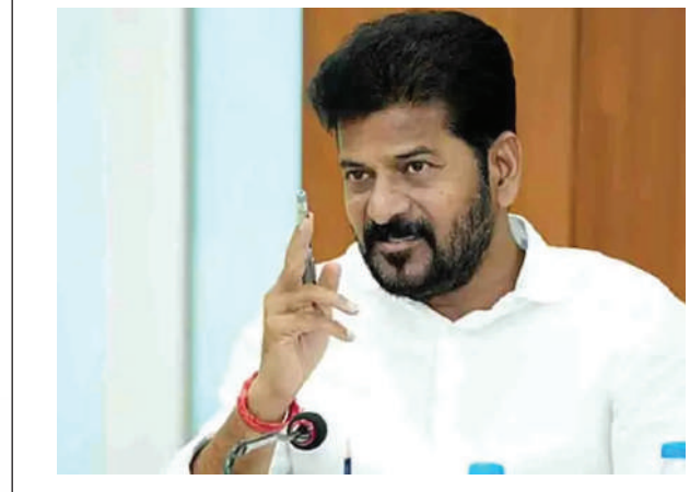
తెలంగాణలో నైట్ టూరిజంపై సీఎం స్పెషల్ ఫోకస్ "తెలంగాణను అంతర్జాతీయ పర్యాటక పటంలో నిలబెట్టేందుకు ముఖ్యమంత్రి రేవంత్ రెడ్డి సరికొత్త వ్యూహాలతో ముందుకు సాగుతున్నారు. ఇందులో భాగంగానే హైదరాబాద్ నుండి కాయ లాంటి చుట్టూ సదా పరివాహక ప్రాంతాన్ని!

మన దేశంలో ఈ ట్రెండ్ ఇంతలా క్లిక్ అవ్వడానికి ముఖ్య కారణాలు: కట్టడాల సరికొత్త రూపం: తాజ్ మహల్, కుతుబ్ మినార్, చార్మినార్ లేదా జైపూర్ కోటలు... రాత్రి వేళల్లో లైటింగ్ (సౌండ్ అండ్ లైటింగ్ షోస్) తో మనస్సు వచ్చే కిక్ వేరు. ఆహ్లాదకరమైన వాతావరణం: పగటి ఉష్ణోగ్రతలతో పోలిస్తే రాత్రిపూట ఉండే చల్లదీ గాలి మానసిక ప్రశాంతతను ఇస్తుంది. ఫోటోగ్రఫీ అద్భుతాలు: నైట్ లైట్ షోట్ గ్రఫీని ఇష్టపడే నేటి యువతకు ఇది ఒక సెలవైవన్.