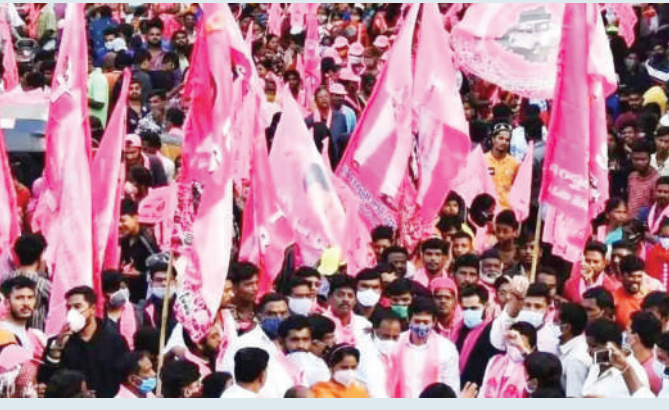
మౌనంగా ఉండగా, యువనేతలు మాత్రం మీడియా అభివృద్ధి కోసం చేస్తున్న ఈ అతి దూకుడు పార్టీని ప్రజలకు దూరం చేస్తోందని విమర్శించి గ్రహించాలి అనిపిస్తోంది. కేంద్ర, రాష్ట్ర ప్రభుత్వాలకు తెలియజేసి, ప్రతిపక్ష హోదాలో ప్రభుత్వంపై పోరాటం చేయాలి. కానీ అది నిరాణాధారంగా ఉండాలి. భాషా పరమైన హింసాత్మక వ్యాఖ్యలకు దూరం ఉండాలి. ప్రతిపక్ష పార్టీ నిరాణాధారంగా ఉండాలి, దానికి వ్యతిరేక దూషణలు తోడవ్వకూడదు అంటున్నారు. ప్రతిపక్ష పార్టీ నిరాణాధారంగా ఉండాలి, దానికి వ్యతిరేక దూషణలు తోడవ్వకూడదు అంటున్నారు. ప్రతిపక్ష పార్టీ నిరాణాధారంగా ఉండాలి, దానికి వ్యతిరేక దూషణలు తోడవ్వకూడదు అంటున్నారు. ప్రతిపక్ష పార్టీ నిరాణాధారంగా ఉండాలి, దానికి వ్యతిరేక దూషణలు తోడవ్వకూడదు అంటున్నారు.

కంటే హింసాత్మక పార్టీ అనే ముద్ర పడ ప్రమాదం అందికంటా ఉంది. బీఆర్ఎస్ అధిష్టానం ఇప్పటికైనా మేల్కొని యువనేతలకు దిశానిర్దేశం చేయకపోతే, రాజీవ్ రోజుల్లో పార్టీ మరన్ని కష్టాలను ఎదుర్కో వాల్సి రావచ్చున్న అభిప్రాయం వ్యక్తమవుతోంది. ప్రజలు నాయకుడి నుండి అశిలవేసిన సమస్యల పరిష్కారం మరెవరినైనా భవిష్యత్తు భరణానికా, ప్రతిరోజూ మీడియాలో బాతులు, శాపవాదాలు, హింసాత్మక పిలుపులు వినిపిస్తున్నాయి. ప్రజల జనం ఆ పార్టీకి క్రమంగా దూరమయ్యే అవకాశం ఉందన్న అభిప్రాయం వినిపిస్తోంది. అంతేకాకుండా క్రమక్రమంగా పార్టీ పట్ల ఉన్న సానుభూతి కూడా కనుమరుగయ్యే ప్రమాదం కూడా లేకపోలేదు. ప్రతి పక్ష పార్టీని పాలకపక్షంపై నిరాణాధారం పోరాటం చేయాలంటే ఏ రకంగా ముందుకు వెళ్ళాలి, ఏయే అంశాలను ప్రధానంగా ప్రజల ముందుంచాలన్న అంశాలపై ఎప్పటికప్పుడు క్షేత్రస్థాయి నాయకులకు మార్గదర్శనం చేసేందుకు పార్టీ సీనియర్లను తెరవేసుకు భార్యతలను అప్పగిస్తే మరి భాగం ఉంటుంది.