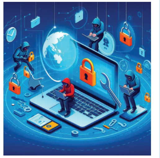
భారత్ లో ప్రస్తుతం మనం చూస్తున్న ప్రధాన సమస్యలు ఇవే

ప్రస్తుత ప్రపంచ ఆర్థిక ముఖచిత్రాన్ని ఒక్కసారి గమనిస్తే.. ఎక్కడ చూసినా ఆర్థికవిషయాల ఇంటెలిజెన్స్ బూమ్, సెమికండక్టర్ చిప్స్, పాటన్లంటికి కేంద్ర బిందువుగా తైవాన్ సెమికండక్టర్ మ్యాన్యుఫ్యాక్చరీంగ్ కంపెనీ గురించే చర్చ జరుగుతోంది. కేవలం 2.3 కోట్ల జనాభా ఉన్న ఒక చిన్న ద్వీప దేశం ప్రపంచ అగ్రరాజ్యాల గమనాన్ని సైతం శాసించడానికి కారణం టిఎంఎస్ అనేదే ప్రకృతి కనిపించే సత్యం. కానీ, ఆ దేశ ఆర్థిక వ్యవస్థ పునాదులను లోతుగా పరిశీలిస్తే ఒక భిన్నమైన, అత్యంత శక్తివంతమైన వాస్తవం బయటపడుతుంది. తైవాన్ అసలు రక్షణ కవచం కేవలం ఒక చివ్ తయారీ కంపెనీ మాత్రమే కాదు ఆ దేశ స్ట్రాక్ మార్కెట్ ను నడిపిస్తున్న 80 శాతం లబ్ధి ఇన్వెస్టర్లు.