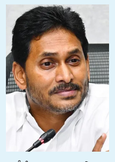
ద్వైనేజీ, మౌలిక సదుపాయాల కోరూ. 2లక్షల కోట్లు ఖర్చు అవుతుంది, ఆచరణ

మావిగన్ అంటే.. బాబుకు గుండె ఆగేలా ఉంది తప్పలను ప్రశ్నిస్తే బీపీ పెరుగుతోంది మా తాతను చంపింది టీడీపీ కాదా? వైసీపీ అధినేత జగన్ పైర తాదేపల్లి: చంద్రబాబు ముఖ్యమంత్రిగా ఉండటం ఏపీ చేసుకున్న దురదృష్టమని వైసీపీ అధినేత వైఎస్ జగన్ అన్నారు. ఏపీకి రాజధాని లేకుండా చేస్తున్నారని, మావిగన్ అంటే బాబుకు గుండె ఆగిపోయేలా ఉందన్నారు. గురువారం ఉయ్యాలపాడులో మాట్లాడుతూ, 'చంద్రబాబు కారణంగా ఏపీ ప్రజలు అష్టకష్టాలు పడుతున్నారు. ఇచ్చిన హామీలకు వెనుకొంటు పోయారు. అమరావతిలో రోడ్లు, నీరు,