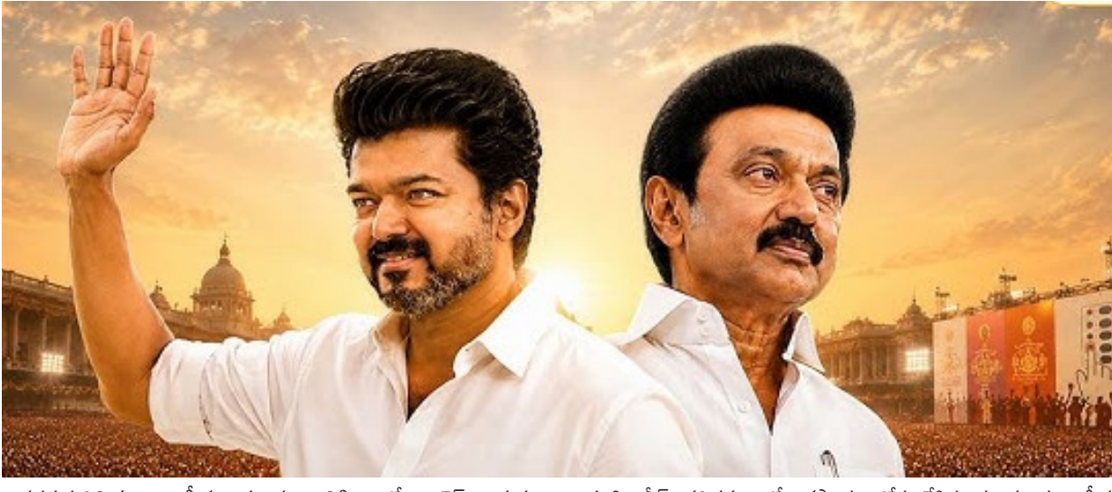
శాసనసభ ఎన్నికలు రాజకీయ అవకాశవాదానికి, అడ్వెంట్ మెంట్ పాలిటిక్స్ కు పరాకాష్ఠగా నిలిచాయి. 'మార్పు' అనే నినాదంతో వచ్చిన కొత్త శక్తి, అధికారం కోసం పాత కూటమిలతో చేతులు కలపడం, నిన్నటి బద్ధ శత్రువులు నేటి మిత్రులుగా మారడం తీవ్ర విమర్శలకు తావిచ్చే అంశంగా మారింది.

తమిళనాడు అసెంబ్లీలో ఇప్పుడు ఆవిష్కృత ముతున్న దృశ్యం ప్రజాస్వామ్య చరిత్రలోనే అత్యంత విచిత్రమైనది. ముఖ్యమంత్రి పీఠంపై కూర్చున్న టీవీకే, ప్రధాన ప్రతిపక్ష నాయకులలో ఉన్న డీఎంకే, అలాగే మూడో స్థానంలో ఉన్న అన్నా డీఎంకే. ఈ పార్టీల జెండాలు, రంగులు వేరైనా పాటి రక్తంలో ప్రవహిస్తున్న సైద్ధాంతిక డీఎంకే మాత్రం సూటికి సూరు శాతం ఒక్కటే. పెరియార్ ఆశయాలు, సామాజిక న్యాయం, లౌకికవాదం, హిందీ వ్యతిరేకత అనే ఒకే సైద్ధాంతిక పునాదిగా పుట్టిన పార్టీలే నేడు అధికారం, ప్రతిపక్ష స్థానాలను పంచుకున్నాయి. దానికి తోడు, ఎన్నికల ముందు వరకూ డీఎంకే కూటమిలో ఉన్న కాంగ్రెస్, వామపక్షాలు, ముస్లిం లీగ్ సైతం ఇప్పుడు అవకాశవాదంతో అధికార టీవీకే ప్రభుత్వంలోకి చేరిపోయాయి. మరి పాలకుల సిద్ధాంతం, ప్రతిపక్షం సిద్ధాంతం, మద్దతుదారుల సిద్ధాంతం అన్నీ 'ఒకటే' అయినప్పుడు... ప్రభుత్వంలోపాలను సైద్ధాంతికంగా ఎం దగట్టేదెవరు? విభిన్నమైన, ప్రత్యామ్నాయ విధానాలను ప్రజల ముందు ఉంచేదెవరు? ముఖాలు మారాయి కానీ భావజాలం మారిన ఈ 'అడ్వెంట్ మెంట్ రాజకీయాలు' చదరంగంలో... *అసలు నిజమైన ప్రతిపక్షం ఎక్కడ? * అన్నది ఇప్పుడు తమిళనాడు చర్చ.