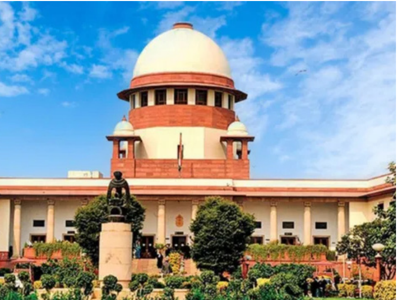
నేపథ్యం - ఇద్దరూ సామాజీకర్లు

సంపన్న (శ్రీశ్రీ) పర్వాలను కోటాల నుంచి మినహాయించడానికి సంబంధించిన నిబంధనలపై దాఖలైన పలు పిల్లలను చుక్కాని చుక్కాని జస్టిస్ బి.వి. నాగరత్న, జస్టిస్ ఉజ్జల్ భుయానల్ తో కూడిన సుప్రీంకోర్టు ధర్మాసనం విచారించింది. ఈ సందర్భంగా కోర్టు సామాజిక న్యాయం, రిజర్వేషన్ల అటువంటి తీరు పలు కీలక, సంబంధం వ్యాఖ్యలు చేసింది. విచారణ సందర్భంగా జస్టిస్ బి.వి. నాగరత్న మాట్లాడుతూ.. "తల్లిదండ్రులు ఇద్దరూ ఐఏఎస్ అధికారులు, ప్రభుత్వ సర్వీసుల్లో అత్యున్నత స్థానాల్లో ఉన్నప్పుడు.. వారిలో సామాజిక పురోగతి ఆర్థిక అభివృద్ధి సృష్టించగలిగినప్పుడు, విద్యా, ఆర్థిక సాధికారతతో ఒక స్థాయికి చేరుకున్న తర్వాత కూడా వారు తమ పిల్లలకు రిజర్వేషన్లు కావాలని కోరుకుంటే, ఈ వ్యవస్థను మినహాయించే అవకాశం ఉందని.. ఇది తీవ్రంగా ఆలోచించాల్సిన విషయం" అని వ్యాఖ్యానించారు. ఒక తరం రిజర్వేషన్ల ద్వారా ఉన్నత స్థాయికి చేరుకున్న తర్వాత, వారి తదుపరి తరాలకు కూడా అదే ప్రయోజనాలు కల్పించడం 'క్రీమీ లేయర్' నిబంధనలతో విరుద్ధమని ధర్మాసనం అభిప్రాయం వ్యక్తం చేసింది. ఒక కుటుంబంలో రిజర్వేషన్లు అందజేస్తే ఉన్నత స్థాయికి వెళ్లిన వారే పదే పదే అదే ఫలాలను చేజిక్కించుకుంటే.. అదే వర్గంలో ఆసలేన, అత్యంత పేదరికంలో మగ్గుతున్న వారికి తీరని అన్యాయం జరుగుతుందని కోర్టు ఆందోళన వ్యక్తం చేసింది. ఈడీ ఉన్నత స్థాయికి వెళ్లిన వారే పదే పదే అదే ఫలాలను చేజిక్కించుకుంటే.. అదే వర్గంలో ఆసలేన, అత్యంత పేదరికంలో మగ్గుతున్న వారికి తీరని అన్యాయం జరుగుతుందని కోర్టు ఆందోళన వ్యక్తం చేసింది. ఈడీ ఉన్నత స్థాయికి వెళ్లిన వారే పదే పదే అదే ఫలాలను చేజిక్కించుకుంటే.. అదే వర్గంలో ఆసలేన, అత్యంత పేదరికంలో మగ్గుతున్న వారికి తీరని అన్యాయం జరుగుతుందని కోర్టు ఆందోళన వ్యక్తం చేసింది.