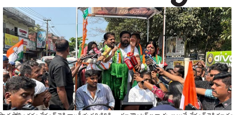
పాత పోషించడం రేవంత్ రెడ్డి రాజకీయ పరిణామానికి నిదర్శనం.

గత ఎన్నికల చేదు అనుభవాలను దృష్టిలో ఉంచుకుని ఈసారి బీజేపీ జాతీయ నాయకత్వం అత్యంత పక దృష్టి వ్యూహంతో అడుగులు వేసింది. ఒకప్పుడు టీఎంసీలో సంబర్ కూడా ఉంది, ఆ పార్టీ లోటుపాట్ల న్ని తెలిసిన వివక్ష నేత సువేంద్ర అధికారి క్షేత్రస్థాయి కేంద్ర పోలింగ్ అంశంపై పా వ్యూహం రంగంలోకి దిగి బాత్ స్థాయి వరకు పర్యవేక్షణ చేయడం పార్టీ క్యాడర్లో నయా జోషీ నింపింది. ప్రధాని సర్వోధ మోదీ సుడిగాలి పర్యటనలు, మమతా బెన్ ద్రే లక్ష్యం కావడం వంటివి మమతా బెన్ ద్రే ప్రధాని మోదీ చేసిన ప్రసంగాలు ఓటర్లను ఆలోచింపజేశాయి.