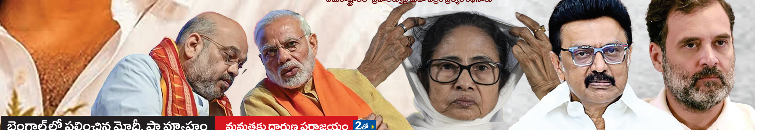
బెంగాల్ లో ఫలించిన మోదీ, షా వ్యూహం మమతకు దారుణ పరాభవం 2లో

విజయ్ సునామీ కల్పి మనదే జగిలా ఎంజీఆర్.. ఎన్డీఆర్ తరహాలో అరంగేట్రంతోనే అద్భుతం తమిళ రాజకీయాల్లో కొత్తశక్తి క్లియర్ ఐడియాలజీ. క్లిన్ ఇమేజ్ అభ్యర్థులు షన్ పాయింట్ మహా 2లో