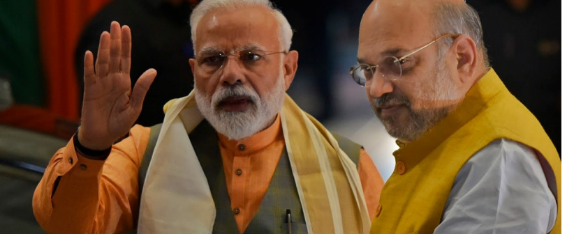
మహా నెట్ వర్క్..

పశ్చిమ బెంగాల్ రాజకీయ యువతపై కమలం వికసించింది. దశాబ్దపు పాటు తిరుగులేని ఆధిపత్యం చలాయించిన తమిళనాడు కాంగ్రెస్ (టీఎంసీ) కండుకొలు బద్దలయ్యాయి. 'మా, మాటీ, మానువ్' (తల్లి, మట్టి, మనుషులు) అనే నినాదంతో జనప్రభ అధికార పీఠాన్ని అధిష్టించిన మమతా బెన్ ద్రే సర్కార్.. నేడు అదే ప్రజల విశ్వాసాన్ని కోల్పోయి ఘోర పరాజయాన్ని మూటగట్టుకుంది. 2021 అనెట్లో ఎన్నికల్లో తన పార్టీకి వేటాడిన అధికారాన్ని, 2026 నాటికి పక్కా వ్యూహంతో బీజేపీ కైవసం చేసుకుంది. అఖండ మెజారిటీ బెంగాల్ రాజకీయాల్లో కాదు అదే చరిత్ర పుస్తకం చరిత్రాత్మక అధిష్టానికి తీరకారం చుట్టింది. దశాబ్దాలుగా వామపక్షాలు, ఆ తర్వాత టీఎంసీ చేతుల్లో బంది అయిన బెంగాల్ పాలన తొలిసారిగా బీజేపీ వశమైంది.