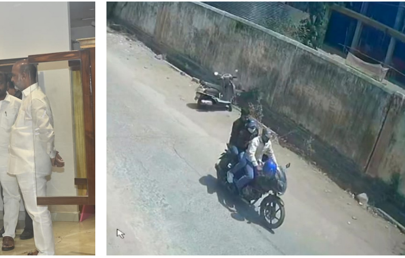
అత్యంత దురదృష్టకరమైన ఘటన అని, అయినప్పటికీ షోరాంను రంగంలోకి దిగారని, దుండగులను కచ్చితంగా పట్టుకుంటారనే ఛార్జి నమ్మకం తనకు ఉందని స్పష్టం చేశారు.

ఈ భారీ డోపింగ్ కోసం దుండగులు ముందుగానే పక్కా రెక్వి నిర్వహించినట్లు స్పష్టమవుతోంది. ఉదయం షోరాం తెరిచిన కాసేపటికే బదుగురు సభ్యుల మూతల అత్యంత పూజాత్మకంగా లోపలికి ప్రవేశించింది.