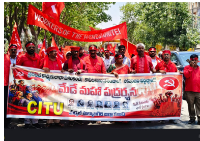
కంగా కార్మిక వర్గం ఐక్యంగా పోరాడాలని పిలుపునిచ్చారు. స్వాతంత్ర్యం ముందు, కర్షాత అనేక బలిదానాలతో సాధించుకున్న కార్మిక చట్టాలను ప్రస్తుతం కార్మికోదే శక్తులకు అనుకూలంగా మార్చే ప్రయత్నాలు జరుగుతున్నాయని, కేంద్ర ప్రభుత్వ విధానాలను