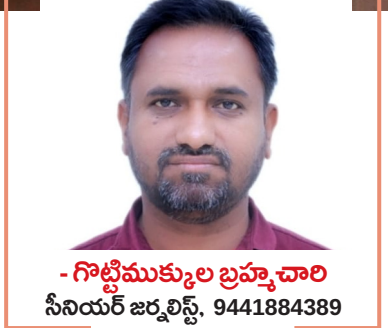
- గొట్టిముక్కుల బ్రహ్మాచారి