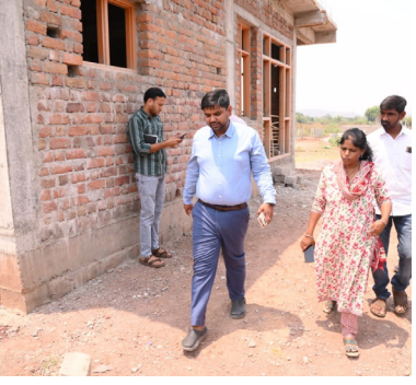
ర్యులతో సరిమాసి క్షేత్రస్థాయిలో పరిశీలించి త్వరగా పరిష్కరించాలని అధికారులకు సూచించారు. ఈ కార్యక్రమంలో సంబంధిత అధికారులు తదితరులు పాల్గొన్నారు.