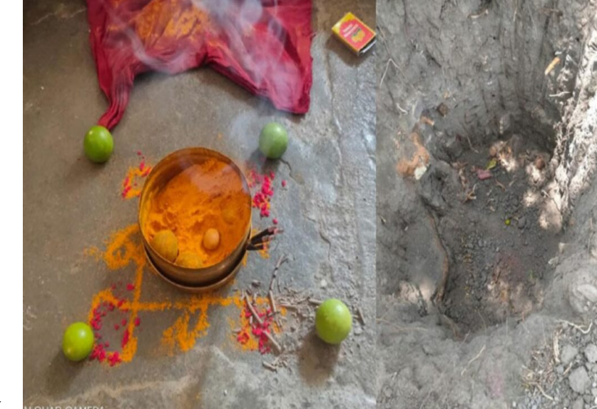
జేసీబీలతో తవ్వకం గోతులు.. గోతుల వద్ద పూజలు నిర్వహించిన దృశ్యం

అమావాస్య రోజున తవ్వకాలు.. మణుగూరు సబ్ డివిజన్ అమావాస్య రోజున తవ్వకాలు జరిపి.. గోతుల వద్ద పూజలు నిర్వహించిన వీడియో ద్వారా నిరూపించి మిడియా వెదికగా తెలుస్తోంది. రాత్రి వేళల్లో ఎవరూ గమనించకుండా ఈ తవ్వకాలు జరుపుతున్నట్లు అనుమానం వ్యక్తమవుతోంది.