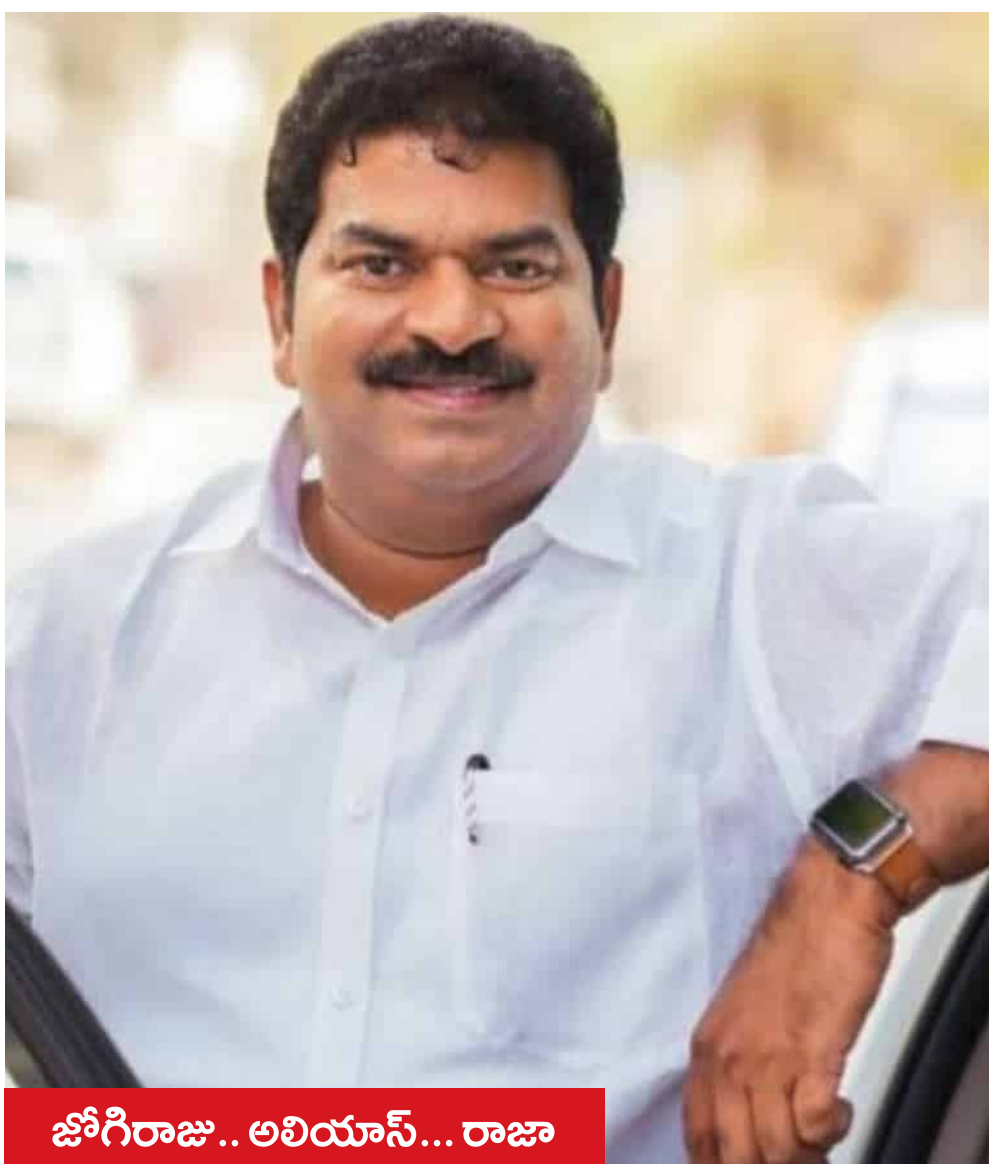
జ్యోతిరాజు.. అరియాన్... రాజా

సేవా గుణమే పునాదిగా రాజకీయ వారసత్వ జననం కాకినాడ జిల్లా పెదకంకర్లపాడి గ్రామంలో 1975 ఆగస్టు 14వ