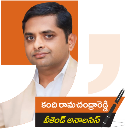
కంది రామచంద్రారెడ్డి పీకెండ్ అనాలసిస్

ఆకాశమంత ఎత్తుకు ఎదిగిన వ్యక్తమైనా.. గాలివాటం మాలిజే నేలకొరగక తప్పదు. రాజకీయంలో 'అజేయుడు' అనే పదానికి కాలం చెల్లిందని తాజా లోక్ సభ పరిణామాల నిరూపిస్తున్నాయి. ఏనుగు ఏడు అడుగులు వెనక్కి వేసేందంటే అది భయపడి కాదు.. దూకడానికి సిద్ధమవుతుందని అర్థం. కానీ, అదే ఏనుగు ఊబలో కాలు వేస్తే? ఇప్పుడు మోదీ-షా ద్వయం పరిస్థితి అలాగే కనిపిస్తోంది. "రాజకీయం అంటేనే చదరంగం. ఇక్కడ ఎత్తులు పారుతాయి.. పొత్తులు కుదురుతాయి. కానీ, ఎప్పుడూ అజేయులుగా భావించే మోదీ-షా ద్వయం వేసిన "స్పెషల్ సెషన్" ఎత్తుగడ చివరకు సెల్స్ గోల్ లా మారింది. 2014 తర్వాత తిరుగులేని అభివృద్ధితో దూసుకుపోతున్న బీజేపీకి, లోక్ సభలో ఎదురైన ఈ పరిణామం ఒక హెచ్చరిక. గాయం తగిలిన చోటే గెలుపు పాఠం మొదలవుతుంది అంటారు.. మరి ఈ గాయం నుంచి బీజేపీ పాఠం నేర్చుకుంటుందా? లేక పతనం మొదలవుతుందా? చాణక్యం చెబిందా? మోదీ మార్క్ 'మేజిక్' లవర్స్ అయిందా? - కంది రామచంద్రారెడ్డి, సీఈఓ, ఏఎన్ఎస్ & మహాపత్రిక పీకెండ్ అనాలసిస్