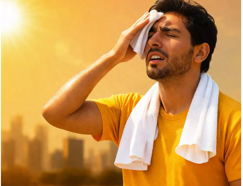
సాధనాలు తప్పనిసరిగా వాడాలి.

ఎండాకాలం ప్రారంభమవుతూనే ప్రజల ఆరోగ్యంపై తీవ్రమైన ప్రభావం చూపే ప్రమాద సమస్యలో వడదెబ్బ (సన్ స్ట్రోక్) ఒకటి. ప్రతి సంవత్సరం ఉష్ణోగ్రతలు పెరుగుతున్న కొద్దీ వడదెబ్బ బారిన పడుతున్న వారి సంఖ్య కూడా పెరుగుతోంది. ముఖ్యంగా వృద్ధులు, చిన్నపిల్లలు, గర్భిణీలు, శారీరక శ్రమ ఎక్కువగా చేసే కార్మికులు, రైతులు, రోడ్లపై పనిచేసే ఉద్యోగులు అధిక ప్రమాదంలో ఉంటారు. సరైన అవగాహన, తగిన జాగ్రత్తలు ఉంటే వడదెబ్బను పూర్తిగా నివారించవచ్చు.