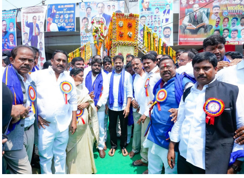
ఎన్నో ఎమ్మీ, బీసీ, మైనార్టీలకు వచ్చాయని వెల్లడించారు. నివారించారు. గతంలో జరిగిన అప్పులు, తప్పులను సరిదిద్దుకుంటూ మేము ముందుకు వెళ్తుంటే కొంత మంది వెనకాల నుంచి కుట్రలు చేస్తూ గోతులు తవ్వకున్నారు. అలాంటి వారిని అదే గోతులో పాతిపెట్టే బాధ్యత మీరు తీసుకోండి.

హైదరాబాద్, మహా: దేశానికి గాంధీ, అంబేద్కర్ రెండు కళ్లు. సాంకేతిక పరిపాటిలో మహాత్మా గాంధీ పాత్ర ఎంత ఉండో.. దేశాభివృద్ధిలో అంబేద్కర్ పాత్ర అంతే ఉందని సీఎం రేవంత్ రెడ్డి అన్నారు. లోయర్ ట్యాంక్ టెంట్ లో నిర్వహించిన డాక్టర్ బీఆర్ అంబేద్కర్ జయంతి వేడుకల్లో సీఎం రేవంత్ రెడ్డి పాల్గొన్నారు. ఈ సందర్భంగా అంబేద్కర్ విగ్రహానికి పూలమాలలు వేసి నివాళులర్పించిన అనంతరం మాట్లాడుతూ.. తెలంగాణ ఉద్యమంలో గడ్డర్ పాత్రను ఎవరూ మర్చిపోలేరని సీఎం తెలిపారు. గత ప్రభుత్వ కేబినెట్ లో దళితులకు ప్రాధాన్యం ఇవ్వలేదని, మా కేబినెట్ లో దళితులకు ప్రాధాన్యం ఇచ్చామన్నారు. దళిత బిడ్డ బడ్డెట్ ప్రవేశపెడితే చూడలేకపోతున్నారంటూ విమర్శించారు. గతంలో భట్టి విక్రమార్కును సీఎమ్మీ నేత హోదాను తొలగించేలా కుట్రలు జరిగాయని సీఎం రేవంత్ ఆరోపించారు. ఎన్నో నాయకుడు స్వీకర్తగా, ఆర్థిక మంత్రిగా ఉండకూడదా అని ప్రశ్నించారు. గత పదేళ్లలో ఎన్నో వ్యూహాల ద్వారా వ్యూహానింపారని తెలిపారు. తెలంగాణ పట్టిక సూట్ విధానంతో పిల్లల భవిష్యత్తు మారుతుందని తెలిపారు. ఇంటిగ్రేటెడ్, పబ్లిక్ స్కూల్స్, ఏర్పాటుకు కృషి చేస్తున్నామని చెప్పారు. అధికారంలోకి వచ్చాక 67వేల ప్రభుత్వ ఉద్యోగాలు కల్పించామన్నారు. 67వేల ఉద్యోగాల్లో 87శాతం