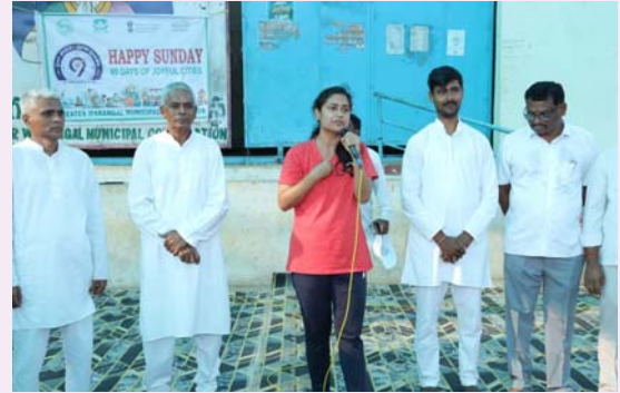
లక్ష్మారెడ్డి, వాకర్స్ అసోసియేషన్ సభ్యులు, తదితరులు పాల్గొన్నారు.