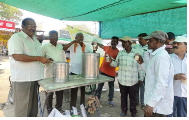
అలక్ గ్రాండ్ వార్క్ వెల్ఫేర్ అసోసియేషన్ ఆధ్వర్యంలో అంబలి పంపిణీ

బెల్లంపల్లి, మహా : మంచిర్యాల జిల్లా బెల్లంపల్లి పట్టణం అంబలి పంపిణీ ప్రాజెక్టులో అంబలి పంపిణీ కార్యక్రమం నిర్వహించారు. ఈ కార్యక్రమంలో అంబలి పంపిణీ కార్యక్రమంలో అంబలి పంపిణీ కార్యక్రమం నిర్వహించారు.