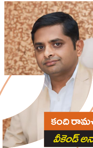
కంది రామచంద్రారెడ్డి వీకెండ్ అనాలసిస్