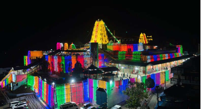
స్వామివారికి పట్టుపస్తాలు, తలంబాల కోసం అణి మేసాలను సమర్పించనున్నారు.

(మొదటివేళ తరువాయి) కనులారా చూసి తరించి, పునీతులవ్వడానికి లక్షలాది మంది భక్తులు గోదావరి తీరానికి పోతున్నారు.