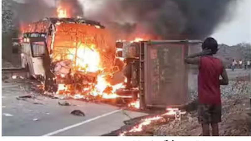
టవడారు. గాయపడిన వారిని పోలీసులు మరియు స్టానికలు వెంటనే మార్కాపురం సమీపంలోని ఆసుపత్రులకు తరలించారు.

మార్కాపురం, మహా: ఆంధ్రప్రదేశ్ లోని ప్రకాశం జిల్లాలో గురువారం తెల్లవారజామున అత్యంత విషాదకరమైన సంఘటన చోటుచేసుకుంది.