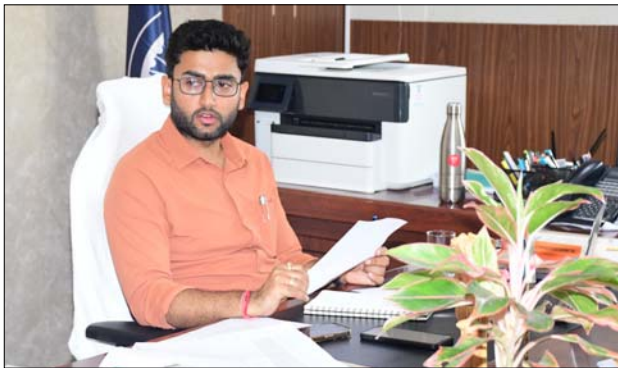
అందించేందుకు తీసుకోవాల్సిన ఏర్పాట్లపై ఈ సమాలోచన జరిగింది. ఈ సందర్భంగా కమిషనర్ మాట్లాడుతూ, "తాగునీటి సరఫరా వ్యవస్థలో లీకేజీల నివారణ, పంపకాలపై నిఖార్సైన పర్యవేక్షణ, అవసరమైనంత నీటి నిల్వల నిర్వహణ వంటి అంశాలపై ప్రత్యేక దృష్టి పెట్టాలి. ఎండాకాలంలో నీటి వృథా జరగకుండా జాగ్రత్తలు తీసుకోవాలి" అని ఆదేశించారు.

పంపిణీ కొనసాగించేందుకు ఈ నిల్వలు ఎంతో బలాన్నిస్తాయని ఆయన పేర్కొన్నారు. ప్రత్యామ్నాయ చర్యలతో కార్యచరణ సిద్ధం. తాత్కాలిక అంతరాయాలు ఏర్పడినపుడే కాక, అత్యవసర సమయంలో కూడా నీటి పంపిణీ కొనసాగించేందుకు ప్రస్తుతం 548 చేతిచుక్క బోర్లు, 76 విద్యుత్ బోర్లు, 14 నీటి ట్యాంకర్లు అందుబాటులో ఉన్నాయని వివరించారు. వీటిని అవసరమైనసరిగా వినియోగించేందుకు ఏర్పాట్లు పూర్తయ్యాయని తెలిపారు.