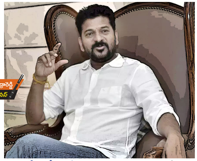
ఏపీ రాజకీయాల్లో అవుడే మొదలైన రేసీ