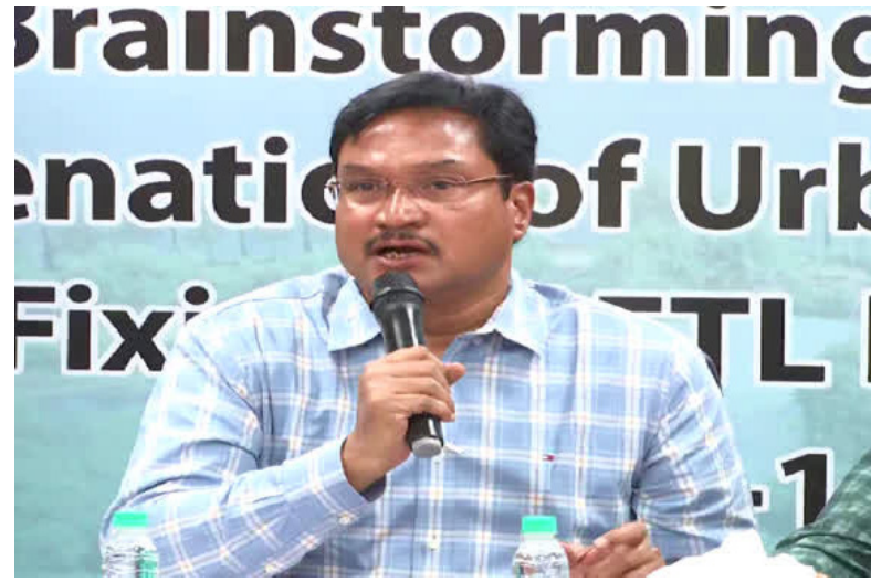
అందరికీ తెలిసినదని అన్నారు. ప్రజల్లో ఎన్ టి ఎల్, బిజెపి జోన్స్ అవగాహన పుస్తోందని, ఆక్రమణల నియంత్రణకు ఆధునిక సాంకేతికతను వాడుతున్నామని వివరించారు. నిపుణులు ఇచ్చిన సూచనలను కీలక నిర్ణయం తీసుకుందని తెలిపారు.

హైదరాబాద్, మహా: నిర్మాణాలు కూల్చే చెరువులు కాపాడటం హైద్రా ఉద్దేశం కాదని, చెరువుల పరిధిలో కొత్త నిర్మాణాలను అడ్డుకోవడం తమ లక్ష్యమని హైద్రా కమిషనర్ రంగనాథ్ అన్నారు. చెరువులను పునరుద్ధరించాలంటే ఇళ్లను కూల్చాల్సి వని లేదని అన్నారు. చెరువులో నీటి విస్తీర్ణం, సర్వే ఆఫ్ ఇండియా మ్యాప్ లు, విజిల్ మ్యాప్ లను కూడా పరిగణనలోకి తీసుకుంటున్నామని తెలిపారు. ఇవాళ హైద్రా కార్యాలయంలోని విశ్రాంత ఇంజనీర్లు, రెవెన్యూ, నీటిపారుదల శాఖ అధికారులతో రంగనాథ్ సమావేశమై హైద్రాకు సంబంధించిన పలు అంశాలపై చర్చించారు. ఈ సందర్భంగా మీడియాతో ఆయన మాట్లాడారు. అక్రమ నిర్మాణాల విషయంలో మానవత్వంతో ఆలోచిస్తే సమాజమంతా బాధపడాల్సి వస్తుందని రంగనాథ్ పేర్కొన్నారు. కొన్నిసార్లు మనుసును చంపుకొని పని చేయాల్సి వస్తోందని వ్యాఖ్యానించారు. ఆమెన్ ఛార్జ్ తూములు మూడుంటేనే లేజిట్టు మునిగాయని తెలిపారు. తప్పుడు అనుమతులు ఇచ్చినవి, అనుమతులు లేని ఇళ్లను మాత్రమే కూల్చివేసామని వాడుతున్నామని చెప్పారు. కొంతమందిపై చర్యలతో హైద్రా పని