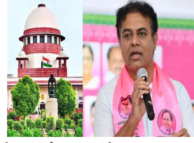
రీజనబుల్ పీరియడ్ అంటే మూడు నెలలు అని మహిషా రేసులో సుప్రీంకోర్టు ఇచ్చిన తీర్పులో స్పష్టంగా ఉందన్నారు.

హైదరాబాద్, మహా: పార్టీ పీఠాన్ని ఆశ్రయించిన ఎమ్మెల్యేలకు సంబంధించిన పిటిషన్లపై హైకోర్టు ఇచ్చిన తీర్పు మీద కేటీఆర్ పార్టీని డిఫెండ్ చేసే కేటీఆర్ స్పందించారు. గత ఎన్నికల్లో తమ పార్టీ నుంచి గెలిచి కాంగ్రెస్ లో చేరిన ఎమ్మెల్యేలకు సంబంధించిన అనర్థక పిటిషన్లపై స్వీకరణ నిర్ణయం తీసుకోకుంటే తాము సుప్రీంకోర్టును ఆశ్రయిస్తామని స్పష్టం చేశారు. మొన్నటి వరకు స్వీకరణ ఆదేశించే అధికారం కోర్టుకు లేదని వాదించారని కేటీఆర్ వివరాలు గుప్పించారు. ఇప్పుడు మాత్రం మరోలా మాట్లాడుతున్నారని మండిపడ్డారు. హైకోర్టు రీజనబుల్ పీరియడ్ అని చెప్పిందని తెలిపారు.