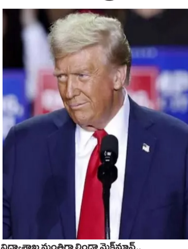
విద్యాశాఖ మంత్రిగా రిండా మెకమన్..

అమెరికా: అమెరికా అధ్యక్ష ఎన్నికల్లో విజయం సాధించిన డొనాల్డ్ ట్రంప్ తన ప్రభుత్వ ఏర్పాటుకు సన్నాహాలు ముమ్మరం చేశారు. అందులో భాగంగా ఎఫ్ బీఐ డైరెక్టర్ పదవిని నింపుతూ వచ్చిన డైరెక్టర్ ట్రంప్ తన పదవికి ఇంటర్వ్యూలు నిర్వహిస్తున్నట్లు ట్రంప్ రెస్పాన్స్ లో తెలుస్తోంది. అసలు ఫలితం తెలుస్తుంది.